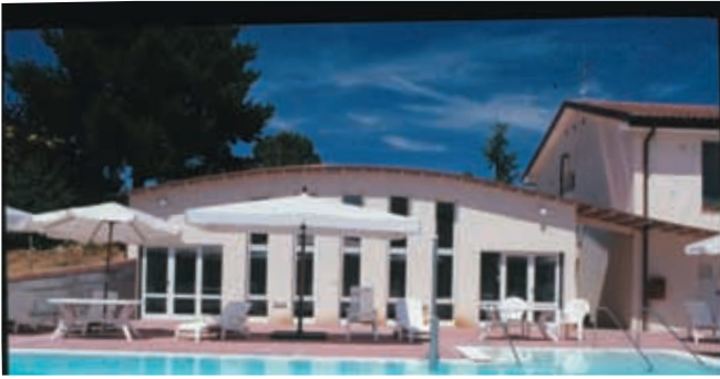
أي جراسولي، توسكاني، إيطاليا

يتم توزيع نشرة إعلامية مع المجلة الصادرة عن جمعية التصلب العصبي المتعدد تقدم شرحاً تفصيلياً حول الحلقات النقاشية وكيفية